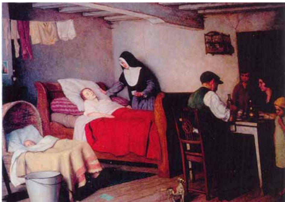
Les Petites Sœurs de l'Assomption assistent les familles ouvrières

Nous trouvons une liste manuscrite des instructions qu'il dut faire, à peu près à cette époque, sous le titre : Sujets d'instructions pour l'Association de la Miséricorde . On saisit, dans ces quelques lignes, ce que devait être son action auprès de la haute société :