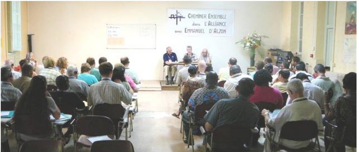
Une assistance studieuse. Maison diocésaine de Nîmes