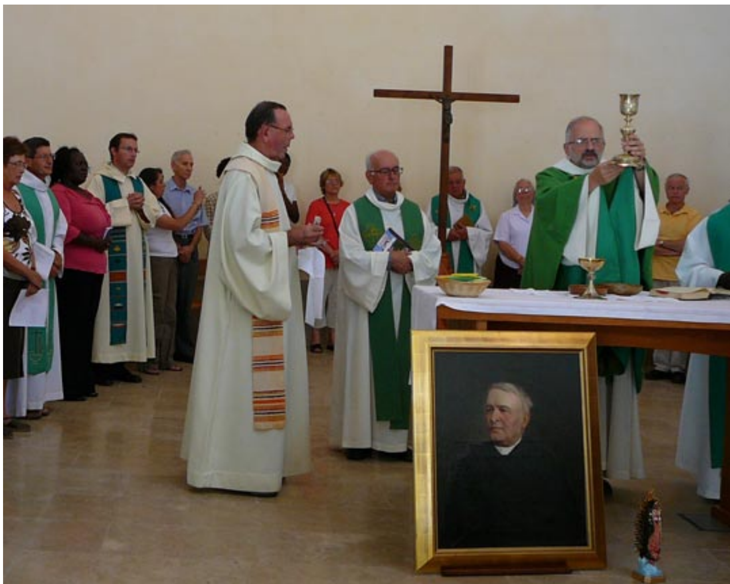
Eucharistie de clôture de la session à la chapelle de l'ex « Prieuré de l'Assomption ».

A l'issue de cette session, nous pouvons sans doute partager un certain nombre de convictions et de perspectives d'avenir. Nous sommes tout d'abord persuadés que cette semaine nous a permis de découvrir combien notre diversité de langues, de tempéraments et d'expériences vécues était une source d'enrichissement mutuel. Nous sommes également persuadés qu'à travers cette diversité nous avons pu mieux prendre conscience du charisme et de l'esprit communs qui nous animent. De plus, nous avons pu mieux comprendre l'importance et la complémentarité de nos vocations spécifiques en tant que laïcs et religieux de l'Assomption.