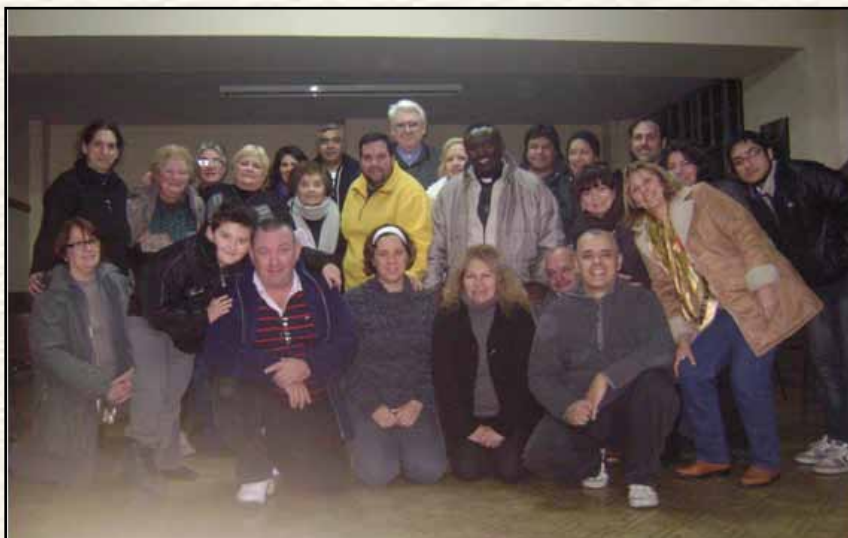
Buenos Aires, Grupo de Oración por los enfermos, en el Santuario de Lourdes que animan pastoralmente los Asuncionistas (religiosos y laicos)

Sí, la fe es un bien para todos, es un bien común; su luz no luce sólo dentro de la Iglesia ni sirve únicamente para construir una ciudad eterna en el más allá; nos ayuda a edificar nuestras sociedades, para que avancen hacia el futuro con esperanza. La Carta a los Hebreos pone un ejemplo de esto cuando nombra, junto a otros hombres de fe, a Samuel y David, a los cuales su fe les permitió « administrar justicia » ( Hebreos 11,33). Esta expresión se refiere aquí a su justicia para gobernar, a esa sabiduría que lleva paz al pueblo (cf. 1 Samuel 12,3-5; 2 Samuel 8,15). Las manos de la fe se alzan al cielo, pero a la vez edifican, en la caridad, una ciudad construida sobre relaciones, que tienen como fundamento el amor de Dios. (Encíclica “ Lumen fidei ” del Papa Francisco, n° 51).