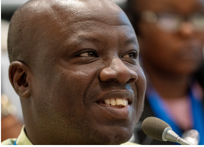
BỞI CHA GEORGES HOUSSOU, BỀ TRÊN MIỀN